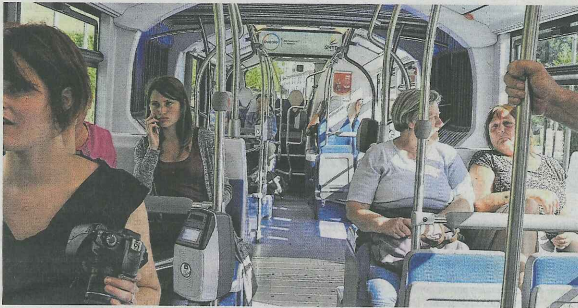
Désormais, on peut rallier Douai depuis Aniche sans changer de bus, en restant tranquillement assis à bord de l'Évéa.

Mis en service le 31 août, le prolongement de la ligne A du réseau Évole permet de rallier Aniche depuis Douai sans changement. En compagnie d'élus et agents du SMTD, on a testé pour vous.